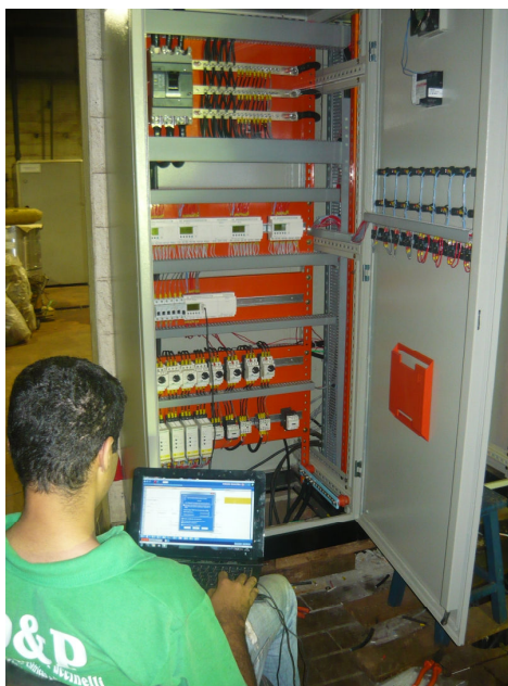
Painel Elétrico Demarchi e Puccinelli Padronizado Seguindo Normas ABNT NBR-5410 e NR-10

Esperamos um breve contato para troca de informações, experiências profissionais e trazer soluções para a sua empresa.